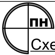
Схема сучасного використання території та схема існуючих обмежень у використанні земель М1:500